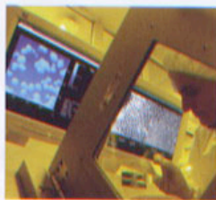
Sopra, rivestimenti superficiali. Il progetto "Domotica" crea un network di aziende che si impegnano nello sviluppo di tecnologie innovative.

La sede di TiFS Ingegneria di Padova, che è stata costruita con caratteristiche di particolare comfort ambientale, acustico, termo-igrometrico oltre che con consumi energetici ridotti. La scelta architettonica si è concretizzata in una struttura dalla morfologia particolare, una sorta di spirale che dal lato est si rivolge verso ovest. L'articolazione dinamica degli spazi d'accoglienza, i contrasti cromatici tra esterno ed interno e l'uso della luce (sia naturale che artificiale) creano una relazione diversa fra edificio ed ambiente nell'arco delle 24 ore: di giorno è un guscio che racchiude e protegge, di notte è opera che si scopre attraverso le trasparenze dei materiali esaltate dalla luce artificiale direzionata sapientemente.